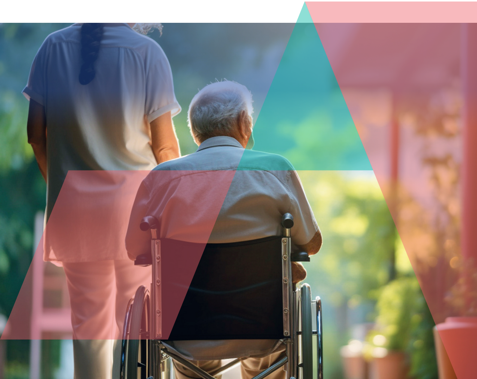
Tableau de bord de la performance Secteur médico-social